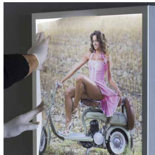
LE IMMAGINI NELLE CORNICI RETROILLUMINATE SONO INTERSCAMBIABILI MEDIANTE UN SEMPLICISSIMO SISTEMA A MOLLA