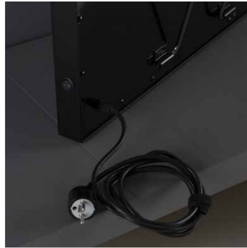
Cavo di alimentazione

I quadri luminosi sono uno strumento per creare atmosfera e ridurre l'utilizzo di altre fonti luminose (e dunque anche i consumi) durante le ore notturne, in negozi, vetrine e ambienti professionali.