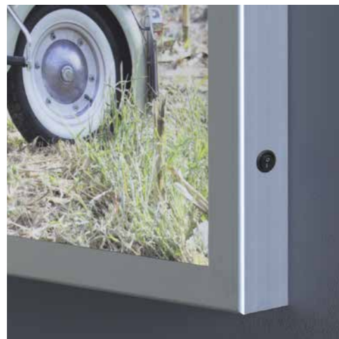
STRUTTURA INDEFORMABILE in alluminio anodizzato ad alto spessore

Ideale per la comunicazione display in store. Perfetto per creare atmosfere suggestive in spazi residenziali.