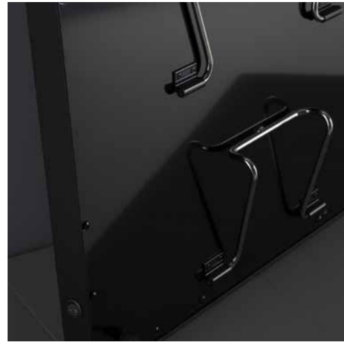
Supporto per appoggio su ripiano