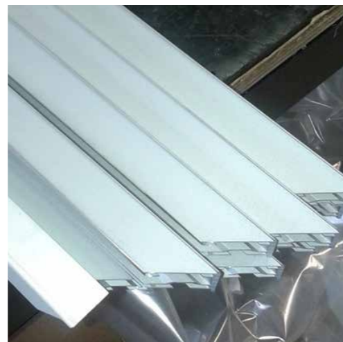
ALLUMINIO ANODIZZATO 40 MM

PRODUZIONE ITALIANA Macchinari all'avanguardia e procedure robotizzate , per garantire la massima precisione .