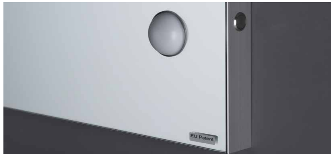
Lenti I-light regolabili in intensità. Interruttore in acciaio

Cantoni ha coniugato la qualità unica del sistema esclusivo di luci I-light , specifiche per il trucco, con specchiere grandi e facilmente combinabili per adattarsi a tutti gli spazi.