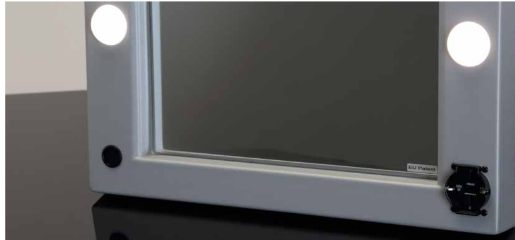
6 luci I-light Presa di corrente universale