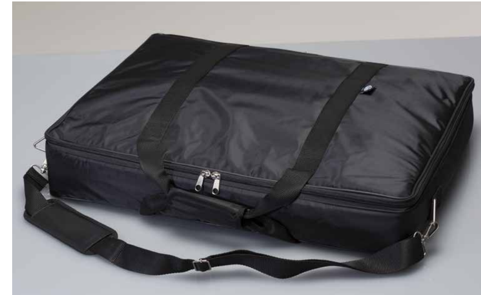
Cover imbottita di protezione in tessuto tecnico

MW01.TSK è il nuovo specchio a 6 luci trasportabile e multiuso della collezione Cantoni, studiato per un utilizzo in movimento e per allestire in pochi minuti aule e sale per seminari, corsi e backstage. Il particolare sistema di supporto e aggancio, "top & drop" ne permette l'utilizzo sia a parete sia in appoggio . Leggero, si trasporta con l'apposita sacca imbottita dotata di maniglioni e tracolla regolabile.