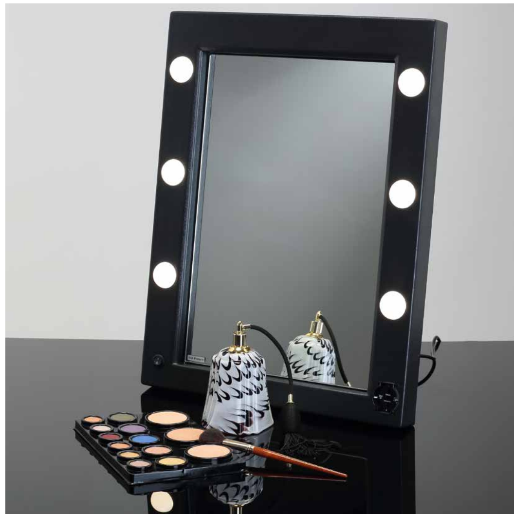
MODALITA' IN APPOGGIO Quando il supporto posteriore è aperto lo specchio diventa da tavolo.