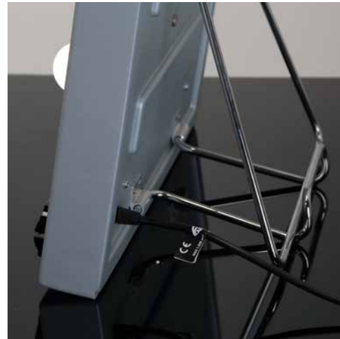
Sistema "DRAG and DROP"